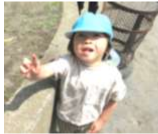
ありさんを捕まえたよ