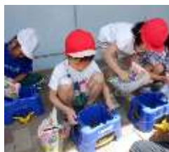
こぼさないようにそおっと土を入れます。

夏になったらどんな色の花が咲くのか、とても楽しみにしている子供たちです。天気に合わせて水やりをするなどお世話を頑張っていきます。