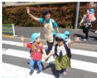
上手に渡りました