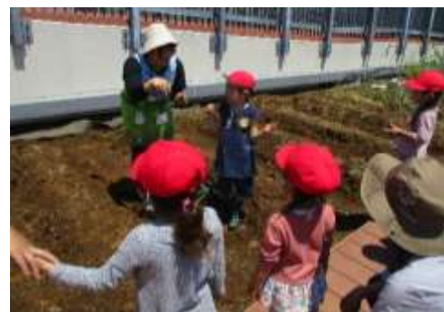
りす組・ぱんだ組