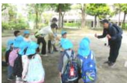
約束を聞いています

公園には、「ブランコ」や「ターザンロープ」などの子供たちの大好きな遊具があります。ぱんだ組やらいおん組は、友達と順番を守って遊んだり、遊具を譲ってあげたりするなど、友達と一緒に仲良く遊ぶ姿が見られました。りす組は生き物を見ることが好きで、ありを見つけると嬉しそうに観察していました。先生やお母さんと一緒にありの巣を探したり、捕まえたりして楽しみました。指先にありをのせることができると、「先生！ありさん。」と嬉しそうに見せに行く姿が見られました。