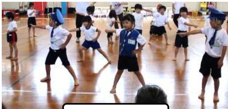
でんしゃ だいすき！