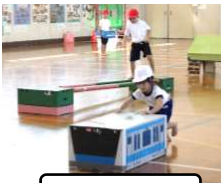
しゅっぱつ しんこう！