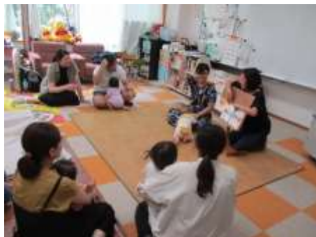
「絵本の読みきかせ」