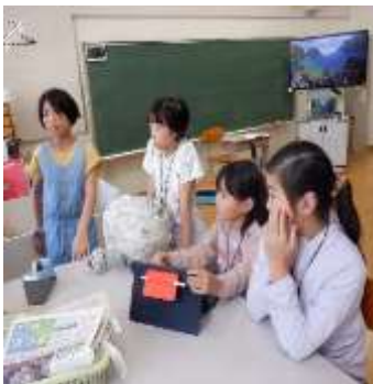
ワークショップの準備風景

本番まで残り3週間。文化祭本番を楽しみに、お子様の様子を見守っていただけたらと思います。