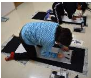
毛筆書初めの様子

小学部では1月11日に席書会を行いました。とても寒い日で、校内には凩とした冷たい空気が漂っていました。3年生以上は廊下で毛筆の書初め、1・2年生は教室で硬筆の書初め、3組は教室で毛筆の書初めに取り組みました。年末から練習してきた各学年の課題に、心を落ち着けて、姿勢を正しくして臨みました。字のバランスを考えたり、力強く大きく書くように気を付けたりして、それぞれが集中して取り組みました。最後にはお互いに自信作を見せ合い、6年生からの「今年も良い年にしましょう。」という話で席書会は締めくくられました。小学部の廊下には冷たい空気の中に年始めらしい墨の香りがしていました。