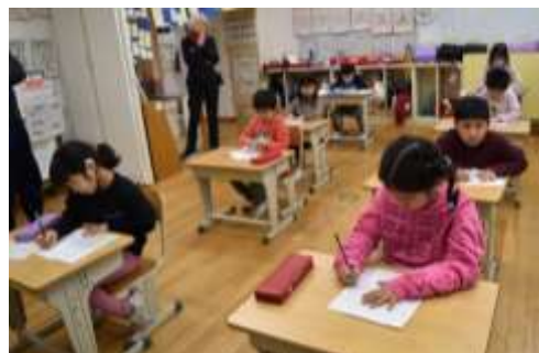
1・2年生 硬筆書初め