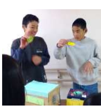
くじで羽根つきのペア決め