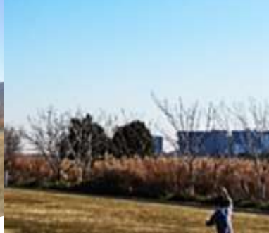
たかく あがったよ