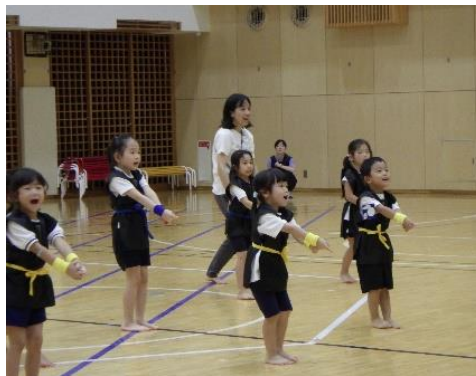
にんじゃたいそう