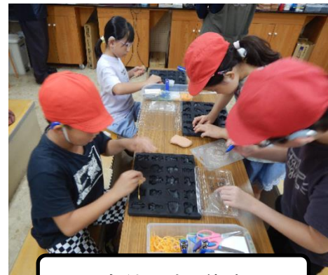
もくねんさん体験