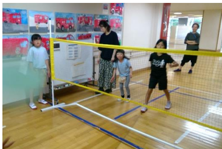
風船バレー、白熱しました

小学部の子供たちは今年も縦割り班活動を行っていて、なかよし班とねこ班の2グループに分かれて活動をしています。すぎなみ夏タイムではグループ毎にゲームを考え、準備・ルール説明までを担当し、一緒に遊ぶ活動を行いました。1年生は初めてのすぎなみ夏タイムでしたが、ルール説明のやり方を上級生に教わりながら、休み時間に一生懸命練習をしました。小高部も、自主的に声を掛け合ってルール説明の練習をしたり、準備物を確認したりすることができ、見通しをもって進めることができました。当日も、お互いの考えたゲームを団結して楽しむことができ、永福分教室のチームワークの良さを発揮していました。