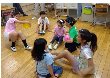
誰が風船を割るかな？