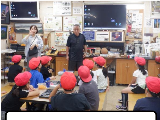
鉛筆の工夫や歴史についてのお話

社会科見学で、葛飾区にある北星鉛筆工場へ行ってきました。鉛筆の作り方や歴史について学習し、鉛筆の芯の材料や、鉛筆と色鉛筆の形の違いを教えてくださいました。元々折れやすかった鉛筆をどうしたら折れにくくできるのか工夫を凝らしてきたという鉛筆の歴史も知ることができ、これまでより鉛筆を大切に使おうという気持ちになりました。工場見学後は、おがくずをリサイクルして作った木の粘土「もくねんさん」で型抜きをしたり、木で作られたおもちゃで遊んだりしました。また、北星鉛筆工場では「鉛筆の供養」として、5cm以下まで短くなった鉛筆を5本、鉛筆地蔵に入るとオリジナルの鉛筆を1本いただくことができます。全員がオリジナルの鉛筆を手にし、「5cmより短くなるまで使う！」と宣言した子どももいました。