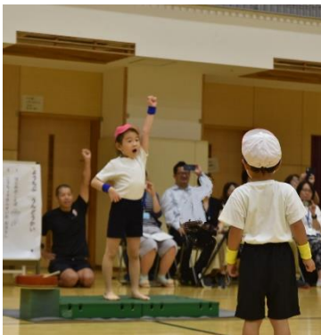
じゅんぴたいそう

幼稚部の運動会のテーマは「忍者！」です。赤白の組分けの発表の後に、種目の発表がありました。「めざせ！にんじゃ！」「にんじゃたいそう」と発表があると、忍者のことを「あ、しってる！」と幼3(3年生)の発言があり、みんなで動画を見ながら確認すると、目がキラキラし始めました。その後、練習が始まると、大人の忍者が毎回登場し修行を手助けしてくれました。「めざせ！にんじゃ！」では、「忍者飛びの術」「橋渡の術」「忍び足の術」「すいとんの術」と修行に励んでいました。その他に、忍者リレーや忍者玉入れも練習するたびに上達していました。そして、最後は、「にんじゃたいそう」。これが最難関の修行です。ハードな踊りに大人は力尽きていましたが、そこは忍者を目指す子供たちです。忍者になるために、最後まで頑張りました。手裏剣、吹き矢、隠れ身、すいとん、変わり身とそれぞれの術を上手に使いこなしていました。本番では、どの種目も一生懸命に取り組む姿、忍者を目指して頑張っている姿、3年生がそれぞれの役割をやり切った姿に保護者の皆様から大きな拍手をもらいました。子供たちの嬉しそうな表情が印象的でした。保護者の皆様、温かい御声援、本当にありがとうございました！