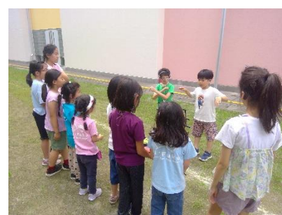
ルール説明も沢山練習しました！