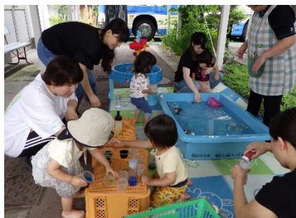
親子でたのしく水遊び！

ひよこ組では、親子での遊びや活動を通して、子供の興味関心に寄り添い、親子で丁寧にかつ楽しくコミュニケーションができるように支援しています。