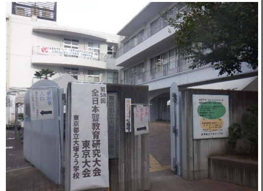
300名を超える参観者が来校しました。

当日は、大塚ろう学校の子供たちが、日頃の学習の成果を存分に発揮し、素晴らしい成長の姿を全国の多くの教育関係者の皆様にご覧いただきました。参加者の皆様からは、子供たちの礼儀や意欲、そして真剣な学びの姿に対して、たくさんのお褒めの言葉をいただきました。特に、子供たちがそれぞれのコミュニケーション手段や、ICT機器等を活用しながら、活発に意見交換を行うなど、主体的・対話的に学ぶ姿は、参加者の皆様から大変参考になったとのご意見を多くいただきました。子供たちの言語力や表現力の向上など、学びの成果は、子供たち自身の日々の努力の賜物です。そして、日々、努力できる力は、保護者の皆様の支えがあってこそです。改めて、心より感謝申し上げます。