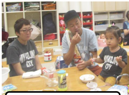
炊きたてのご飯、おいしい!