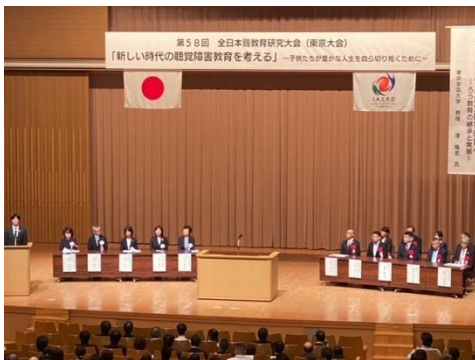
開会式の参加者数は約700名でした。

このようなご意見やご感想をいただけたことは、私たち教職員にとっても大変誇らしく、何よりも励みとなりました。この大会を通じて、大塚ろう学校が目指す「聴覚に障害のある子供たちが、将来の社会参加・自立に向けた確かな力を身に付ける学校」に向けて、着実に前進していることを再確認するとともに、ろう教育に関する様々な視点やアプローチを学び、共有する貴重な機会となりました。この成果を今後の教育活動に活かし、さらに質の高い教育を提供できるよう、教職員一同、一層の努力を続けてまいります。