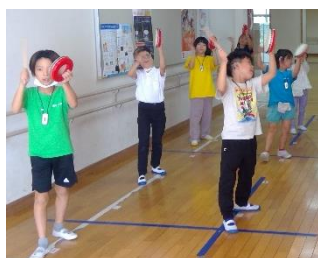
エイサーメドレー