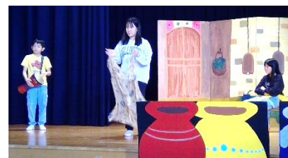
アリババと とうぞくたち