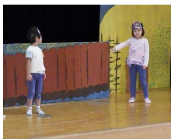
とろると やぎの おはなし