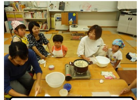
もうすぐ、ゆであがるかな?