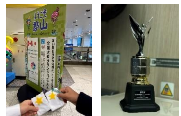
成功を祈る手作りお守りと栄光のトロフィー