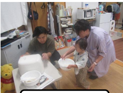
お米を、入れようね。

おうちでも繰り返し行っている活動は、お子さんが見通しをもつことができ、必然性のあるコミュニケーションが生まれます。おいしい秋の味覚を味わいながら、みんなで楽しんだお料理活動でした。