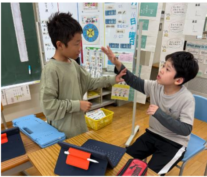
ワークショップの準備の様子

本番までの3週間。文化祭に向け、ご理解ご協力をいただきましてありがとうございます。文化祭本番を楽しみに、お子様の様子を見守っていただけたら幸いです。