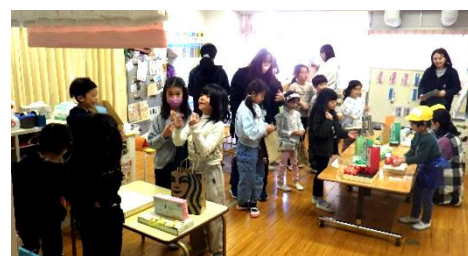
おみせやさんごっこ当日