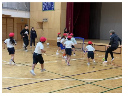
小低～デフサッカー教室