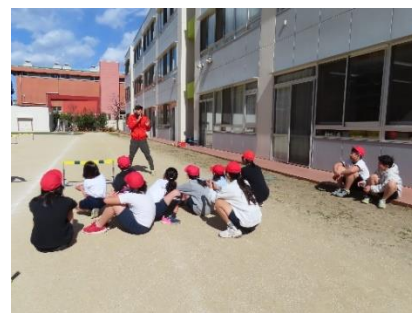
小高～デフ陸上教室